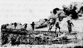
যুদ্ধত পইজন্মেগেছর আক্রমণ

ব্রহ্মদেশত প্রবুদ্ধ শিশু ব্রহ্মদেশত সন্তান চাইন নামে এটি পাঁচ বছরীয়া লাবর অঙ্গাধারন প্রতিভার পবিচর পোহা গৈছে । তার বোলে ২৬ বছর বয়সর পবাই অসুত বক্ততা শক্তি বিকাশ হৈছে, আক সেই সময়বে পরা শরটিয়ে বোলে জনসাধাবনক ধর্মর বিষয়ে উপদেশ দিবলৈ আরম্ভ কবিছে । তার আকৃতি প্রকৃতি সাধাবন লাবর দবে, অঙ্গাধারন একো নাই । কিন্তু আশ্চর্যর বিষয় যে সি হেমালি কবি থাকোতে থাকোতে হঠাৎ ইচ্ছা হলেই পল্লীর জ্ঞানপূর্ণ উপদেশ দিবলৈ ধবে । তার ব্যক্তিতা বর আচরিত ; ভাবাত কোনো প্রকার ধোকাছা বা অসামঞ্জস্য নাই । আক আশ্চর্যর বিষয় যে দেখা-পড়া নিশিকা- কৈয়ো এই লবাইয়ের বন্দী আক পালি ভাষাব পুথি অনাধাসে পঠিব পাৰে, আক স্মললিত ছন্দেবে অঙ্গুজ কবিব পারে । বক্তৃতাব সময়ত তার শবালি ভাব নাখাকে ; তাব মুখ তেতিয়া জ্যোতিষ্য হৈ পবে ।