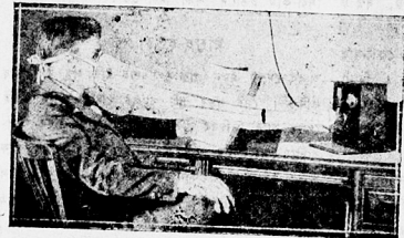
উপাধব সৈতে পেছলোহা হয়

যুদাইটেজ, ছোটছ আক কানাডার সকলোবোবর হুহপিটালতে বন্দা ইত্যাদি জীবন যাধির চিকিৎসা এই পেছেবে করা হৈছে । তার উপবিও, লুগলব, বাজহুয়া সভা-সমিতির দ্বব, থিয়েটার দ্বব ইত্যাদি- বোবত এই পেছ হেনেই কীর্গটেক দিবর বিহা করা হৈছে । ইজাব স্বাভাবি আন এখন বাধিগত মাহুতঃ নিশাদেদি ওলাহা নীজ পুথোবর বিমাল সাধন হব, তেতিয়া আক আন মাহুতঃ গাত সি সোমাব নোহাবে ।”